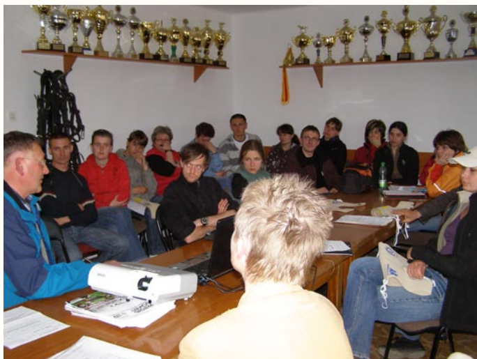
Odprawa przed startem.