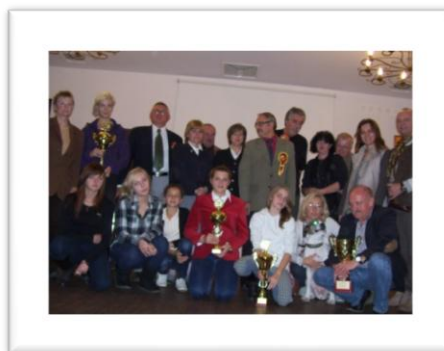
Komisja sędziowska, Komisja weterynaryjna, Zawodnicy, przedstawiciele sponsorów